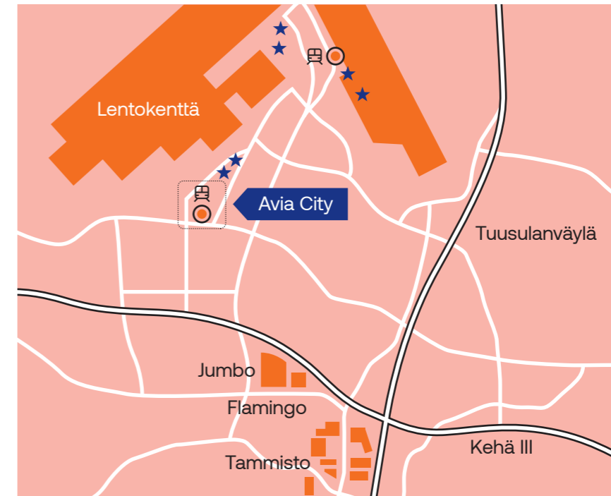
★ muita Avia Clubin tiloja