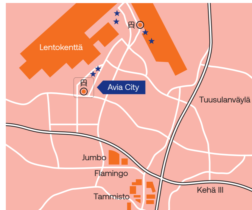
★ muita Avia Clubin tiloja